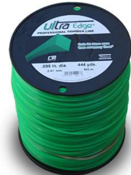
Bobina 406 Metros Codigo 14007

Square-shaped technology with sharp cut through heavy vegetation.