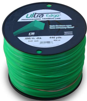
Bobina 246 Metros Codigo 14002