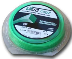
Display 12 Metros Codigo 13990

Nylon de Recarga Ultra-Edge Doble Componente Shakespeare®