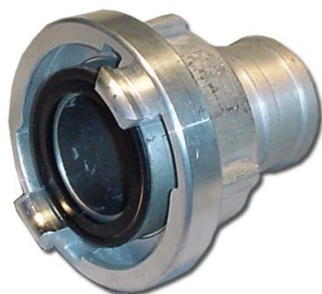
Unión Storz cola larga