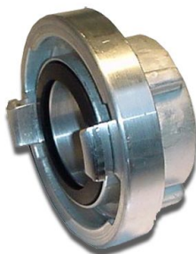
Tuerca Storz Hilo Interior