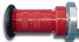
Pitón Neblinero Corto