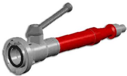
Pitón de Palanca 3 Posiciones